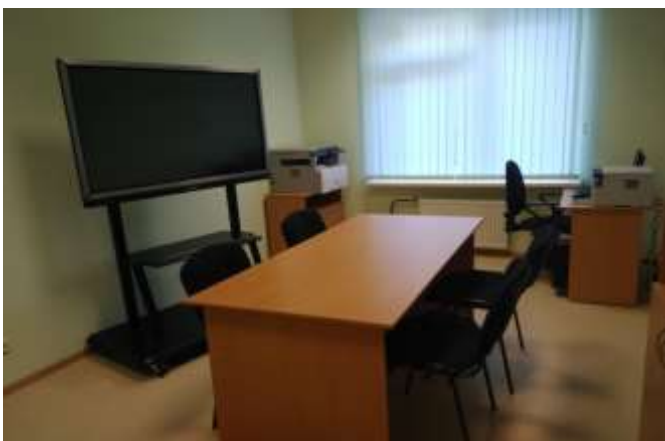
Библиотека для преподавателей