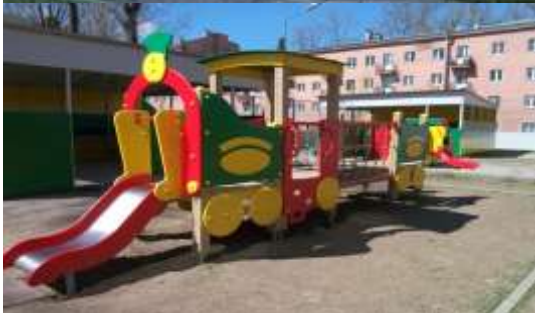
Спортивные площадки (2)