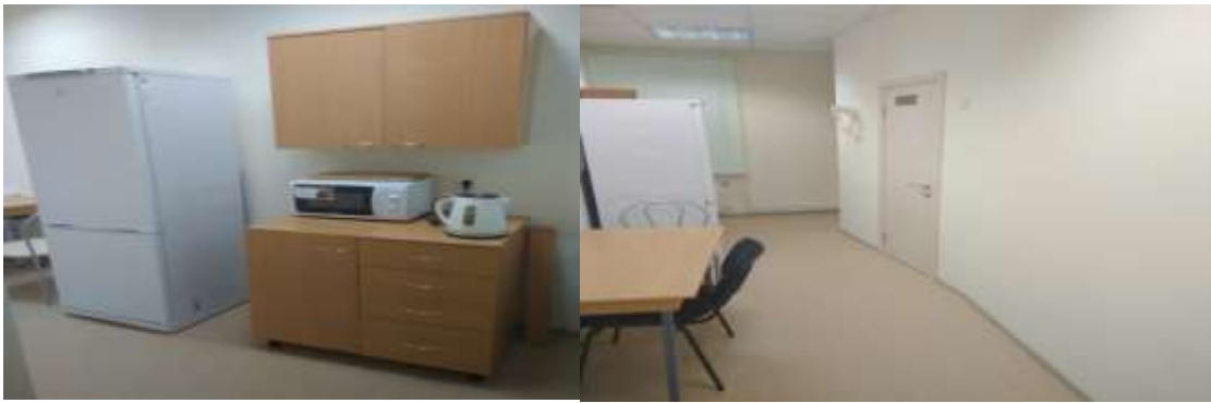
Медицинский кабинет (2 медицинских кабинета), изоляторы (2)