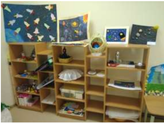
Группы кратковременного пребывания