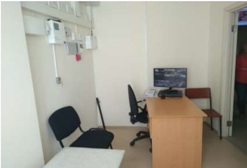
Ифозона (информационная зона) находится в холле детского сада