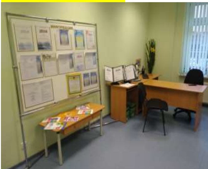
Комната отдыха для педагогических сотрудников и сотрудников пищеблока (2 комнаты)